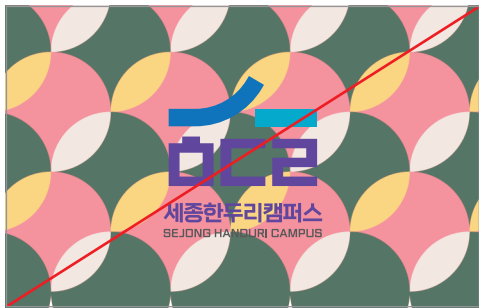
복잡한 패턴위에 심볼을 적용한 경우

금지규정은 로고 적용 시에 생길 수 있는 오용사례를 제시하고 있습니다. 아래와 같은 잘못된 적용에 주의하여 본연의 이미지를 손상시키지 않도록 합니다.