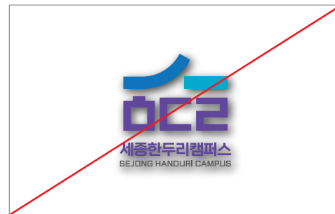
심볼마크를 해치는 효과를 사용한 경우