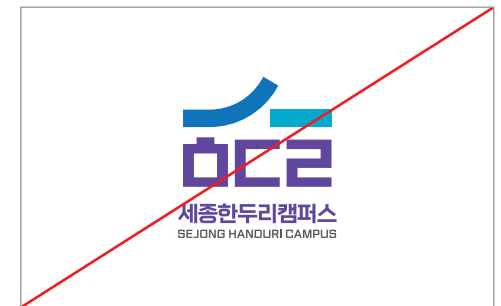
잘못된 조합을 사용한 경우