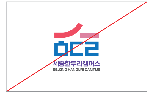
잘못된 색상을 사용한 경우