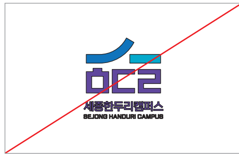
심볼에 테두리를 준 경우