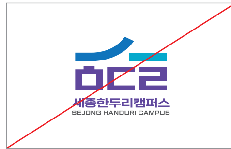
심볼의 형태를 변형한 경우