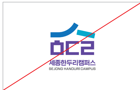
심볼요소의 각도를 변경한 경우